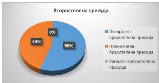
Графички приказ број 5

Она што, исто така, е позитивно и што произлегува од оваа анализа е дека вкупно 9 првостепени пресуди за кои е поднесена жалба, 5 жалби биле поднесени од страна на Јавното обвинителство за организиран криминал и корупција и тоа во последните 3 години. Четири жалби се поднесени од страна на обвинетите, а во 3 случаи жалби се поднесени и од обвинетите и од Јавното обвинителство за организиран криминал и корупција. Со второстепената пресуда, 5 од првостепените пресуди се потврдени, додека 4 се преиначени. Кај сите првостепени пресуди што се преиначени, промената е во делот на санкцијата, при што секогаш е определувана построга санкција од изречената во првостепената пресуда.