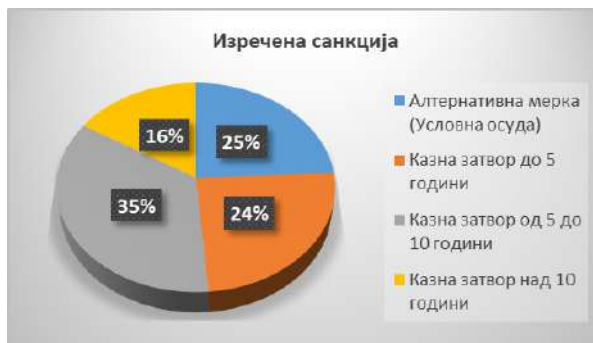
Графички приказ 6

на првоосудената и е изречена казна затвор од 13 години, а на останатите казна затвор од по 12 години. По жалба од страна на јавното обвинителство за организиран криминал и корупција, преиначена е пресудата во однос на санкцијата и се зголемени казните затвор на сите осудени и тоа за првоосудената е изречена казна од 17 години затвор, а за останатите по 14 години затвор.