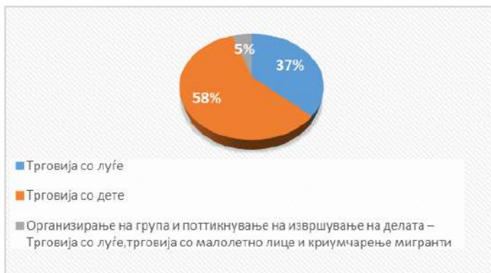
Графички приказ број 4

Во однос на видот на кривичното дело , од графичкиот приказ број 4 произлегува дека во пресудите преовладува делото Трговија со дете (чл. 418-г од КЗ) и тоа во 11 од пресудите, а седум ( 7 ) од пресудите се за кривичното дело Трговија со луѓе (чл. 418-а од КЗ) и една ( 1 ) пресуда се однесува на делото Организирање на група и поттикнување на извршување на делата трговија со луѓе, трговија со малолетно лице и криумчарење мигранти (чл.418-в од КЗ).