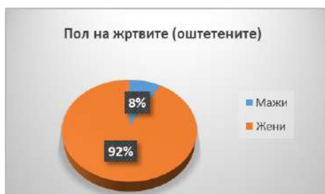
Графички приказ бр.3