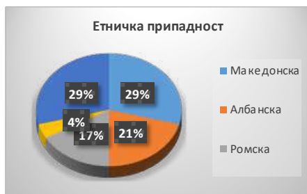
Графички приказ бр.1