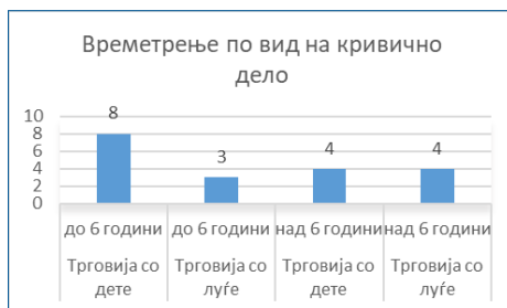
Графички приказ број 11

Кривичната постапка во која дете се јавува како жртва е итна , 206 при што судот и другите органи постапуваат без одолговлекувања со цел да се одбегнат можните штетни последици за развојот и личноста на детето. Од графиконот број 11 произлегува дека 12 пресуди се однесуваат на кривичното дело – Трговија со дете. Според приказот во однос на траењето на постапката, до 6 години траела постапката во 8 пресуди за кривичното дело - трговија со дете, а во 3 пресуди за кривичното дело Трговија со луѓе. Постапката траела над 6 години во еднаков број (по 4 пресуди) на пресуди за двата вида на кривичното дело, што сепак е