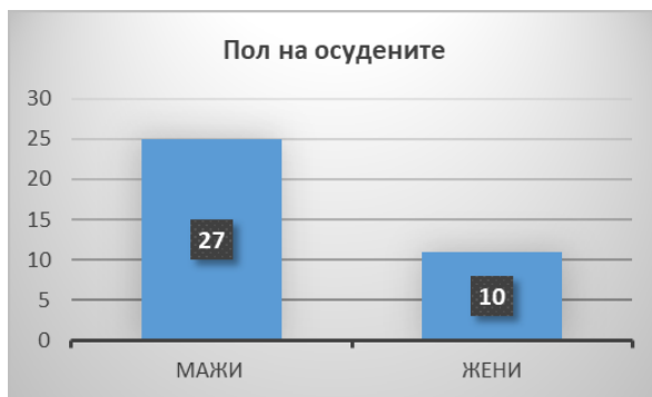
Графички приказ број 7

Во првостепените пресуди кои се предмет на анализа, осудени се вкупно 37 лица. Од нив 27 се мажи, а 10 се жени. Од 37 осудени лица, 8 се осудени поради користење на сексуални услуги или друг вид експлоатација од лица за кое знаел или бил должен да знае дека е жртва на трговија со луѓе. 105