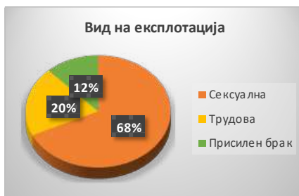
Графички приказ бр.2