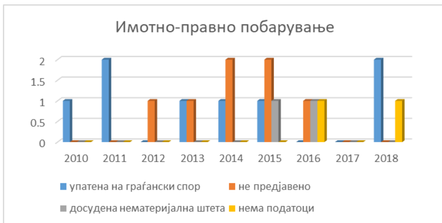
Графички приказ број 12

добиени пресуди каде е досуден надомест на штета на жртва во кривично дело Трговија со луѓе. Националните власти посочија дека ниту една ЖТЛ не поднела барање за обештетување во текот на извештајниот период 304