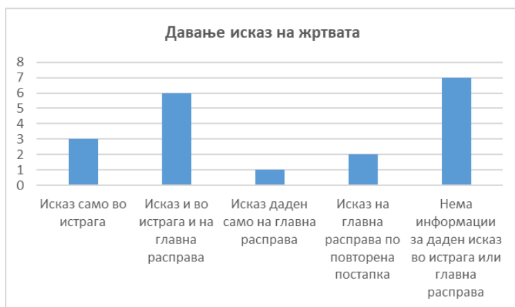
Графички приказ 8

истрага со согласност на обвинетиот. 139 Во 6 пресуди 140 даден е исказ од страна на жртвата и во истрага и на главна расправа. Во 7 предмети 141 воопшто нема информација дали жртвата дала исказ во истрага или на главна расправа. Во еден предмет 142 жртвата одбила да даде исказ во истрага, а дала исказ само на главна расправа во корист на обвинетиот. Во еден предмет 143 жртвата дала исказ на главна расправа, по решение за повторување на постапката (со што вкупно била сослушана 3 пати). Во еден предмет 144 жртвата дала исказ во истрага и на две рочишта на главна расправа во првата постапка и исказ на главна расправа на повторената постапка во корист на обвинетиот (со што била сослушана вкупно 4 пати). Во еден предмет 145 нема информација дали жртвата дала исказ во истрага, а дала исказ на главна расправа.