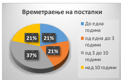
Графички приказ број 10

Во однос на аспектите на ефикасно водење на кривичната постапка, важно е да се напомене податокот за времето што е поминато од отпочнување на постапката па сè до донесување на првостепената пресуда. Имено, на графиконот број 10 се наведени дел од завршените постапки и нивното времетраење. Од вкупниот број на пресуди, за четири од пресудите постапката траела до 1 година , од кои најкратката траела три месеци. 203 Во четири од пресудите постапката траела од 1 до 3 години , а во останатите 10 пресуди постапката траела над 3 години . Од нив во четири пресуди, вклучувајќи ја и второстепената пресуда, постапките траеле над 10 години, 204 а најдолгата постапка траела дури 16 години. 205